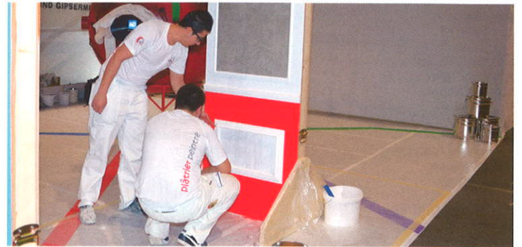
Les apprentis présents sur le stand ont fait la démonstration des métiers de plâtrier et peintre.