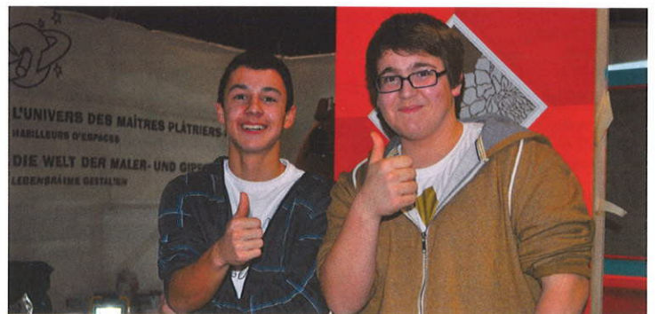
L'idée a conquis ces deux jeunes.